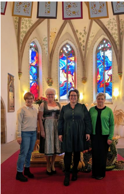
Erntedank im Oktober