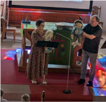
Einschulungsgottesdienst im August