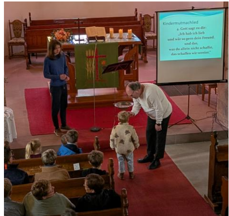
Tauferinnerung im September